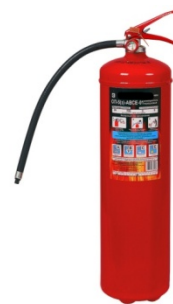
Рис. 5 – порошковый огнетушитель

Огнетушители порошкового типа применяются в основном для тушения ЛВЖ и ГЖ. Принцип действия порошкового огнетушителя основан на выпуске под давлением порошка, который изолирует очаг возгорания, тем самым ликвидируя его. Использование данного типа огнетушителя приводит к образованию токсичного облака, которое в тесном пространстве небезопасно для здоровья человека. Также после оседания облака порошка пострадает и все имущество, находящееся в помещении.