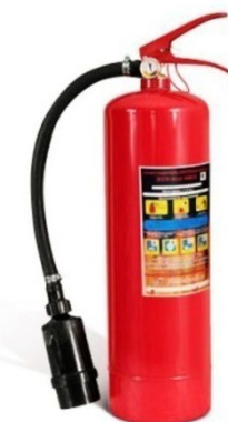
Рис. 6 – воздушно-пенный огнетушитель

Воздушно-пенные огнетушители являются наиболее подходящим вариантом при тушении строений и предметов мебели из дерева, поэтому при выборе огнетушителя для домашнего использования необходимо учитывать, какие материалы преобладают в помещении. Следует учитывать и минусы воздушно-пенных огнетушителей, так как самым главным их недостатком является то, что ими запрещено тушить электрические приборы и технику, а также они замерзают при низких температурах.