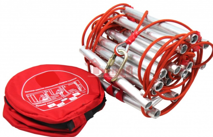
Рис. 10 – навесная спасательная лестница

в легкодоступном месте жилого помещения, при необходимости использования лестница фиксируется за специальные анкеры, установленные в непосредственной близости к месту предполагаемой эвакуации и вывешивается снаружи здания. Спуск по лестнице спасаемые производят самостоятельно. Основным достоинством данного типа спасательного оборудования является простота его использования. Высота спуска не более 15 метров.