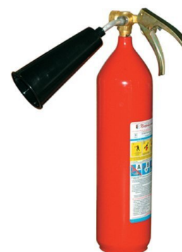
Рис. 4 – углекислотный огнетушитель

Углекислотный огнетушитель является наиболее оптимальным вариантом для жилых помещений, в первую очередь это связано с большим количеством пожарной нагрузки в помещениях, также углекислотный огнетушитель является наиболее эффективным для тушения возгорания бытовой техники или проводки. Одно из явных преимуществ углекислотных огнетушителей – его безопасность для здоровья человека.