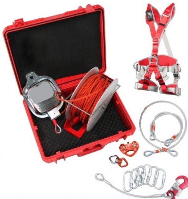
Рис. 9 –канатно-спусковое устройство

Наиболее простыми в использовании являются канатно-спусковые устройства и складные навесные лестницы. Канатно-спусковые устройства делятся на две группы: с автоматическим регулированием скорости спуска, для использования которых не требуется специальная подготовка, и с ручным регулированием, при использовании которых требуется специальная подготовка. Высота спуска в обоих случаях зависит от длины каната.