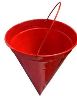
Рис. 1 – пожарное ведро

Вода - самое распространенное средство для тушения огня. Огнетушащий эффект воды заключается в охлаждении горящих материалов и очага пожара. Вода электропроводна, поэтому ее нельзя использовать для тушения сетей и установок, находящихся под напряжением. При попадании воды на электрические провода может возникнуть короткое замыкание и удар электрическим током. Также вода неэффективна при тушении горящего масла, так как она легче большинства ЛВЖ и ГЖ. Тушение масел и других горючих жидкостей водой приводит к увеличению площади горения.