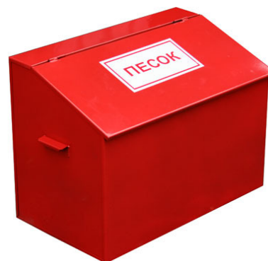
Рис. 2 – ящик с песком

Песок и земля с успехом применяются для тушения небольших очагов горения, в том числе разливов горючих жидкостей (керосина, бензина, масла, смолы и др.) Насыпать песок следует по внешней кромке горячей зоны, стараясь окружать песком место горения, препятствуя дальнейшему растеканию жидкости. Затем при помощи лопаты нужно покрыть горящую поверхность слоем песка, который впитает жидкость.