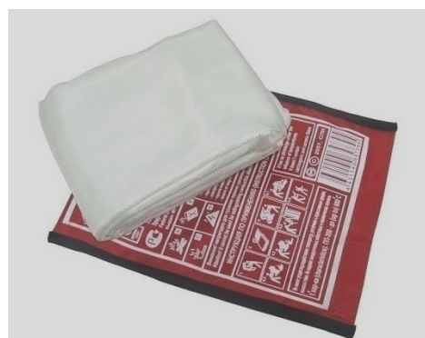
Рис. 3 - кошма

Противопожарное полотно (кошма) предназначена для изоляции очага горения от доступа воздуха. Этот метод очень эффективен, но применяется лишь при небольшом очаге горения. Нельзя использовать для тушения синтетические ткани, которые легко плавятся и разлагаются под воздействием огня, выделяя токсичные газы. Продукты разложения синтетики, как правило, сами являются горючими и способны к внезапной вспышке.