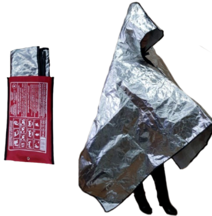
Рис. 8—специальные огнестойкие накидки